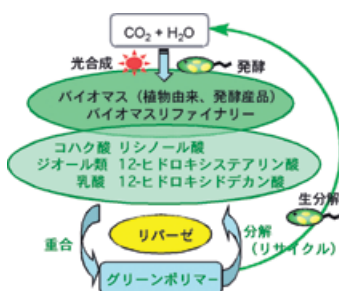
図1. グリーンポリエステルの創製概念図

リパーゼはそれ自体生体物質であり、天然物と親和性が高く、バイオマスリファイナリー原料を用いるバイオベースポリマー創製に有効である。図1にはバイオマスリファイナリー製品として期待できる有機酸やジオール類からのグリーンポリエステルの創製概念図を示した。発酵由来コハク酸とブタンジオールからのポリブチレン